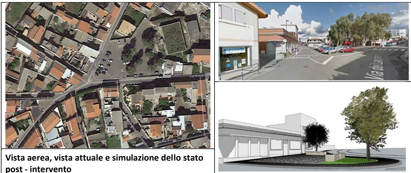
Vista aerea, vista attuale e simulazione dello stato post - intervento

L'intervento prevede una riorganizzazione complessiva dello spazio urbano e della viabilità in corrispondenza dell'incrocio con la via Partigiani e la via Armando Diaz. Attualmente, detto incrocio è caratterizzato da un'ampia area a parcheggio che occupa buona parte dello slargo in corrispondenza dell'incrocio, dalla sede carrabile della via dei Partigiani, sovradimensionata in corrispondenza della confluenza sulla via dei Lavoratori a causa della definizione del senso unico di percorrenza, e da uno stretto spazio pedonale attiguo agli edifici di detta via dei lavoratori, sedi di attività commerciali. Il piano stradale è unico, e le delimitazioni tra spazi di viabilità veicolare, parcheggio e sede pedonale sono costituiti da semplice segnaletica orizzontale o da transenne fisse di separazione che rafforzano l'angustia dello spazio pedonale.