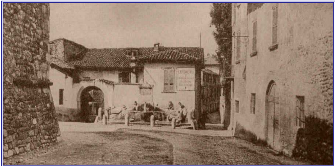
La fontana Foglieni di Solza in una vecchia foto