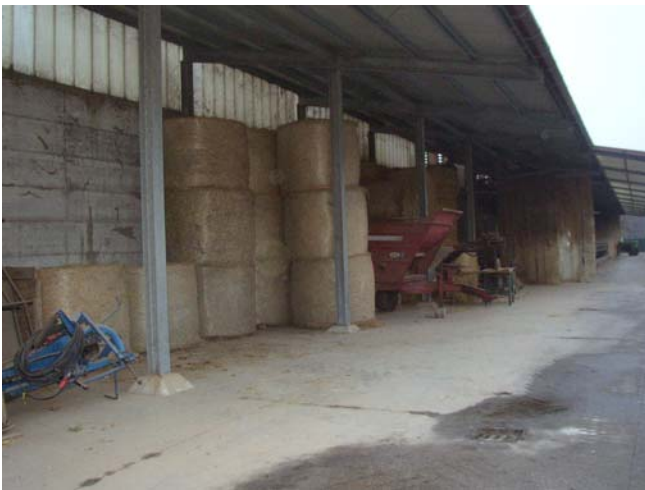
VISTA 15 Tettoia – vista da nord/est