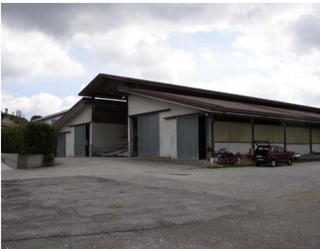
VISTA 9 Stalla/dep. insilati-fienile - vista da nord/ovest