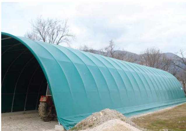
VISTA 1 Serra in precario