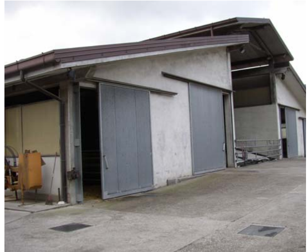
VISTA 8 Stalla/dep. insilati-fienile - vista da nord/est