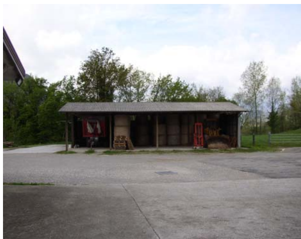
VISTA 4 Deposito attrezzi agricoli – vista da est