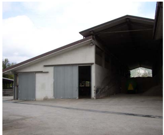
VISTA 10 Stalla/dep. insilati-fienile fronte sud