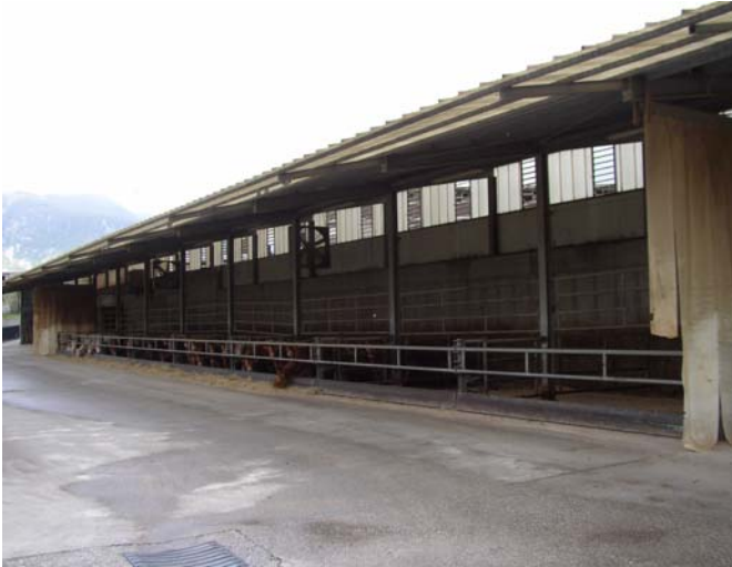
VISTA 13 Tettoia – vista da sud/ovest