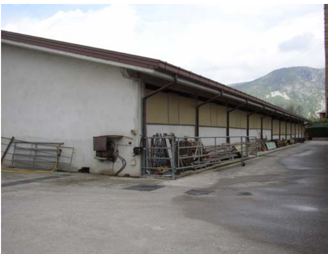
VISTA 11 Stalla/dep. insilati-fienile – angolo sud/est