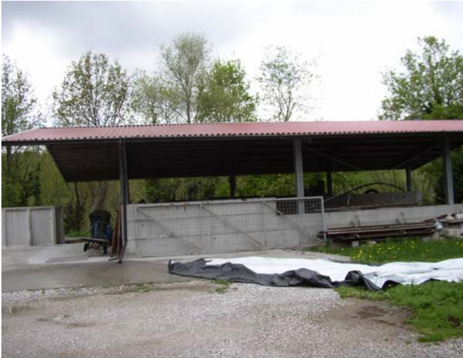
VISTA 7 Concimaia – vista da nord/est