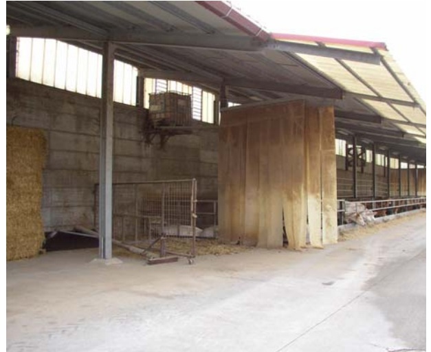
VISTA 14 Tettoia – vista da nord/est