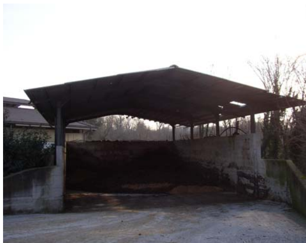
VISTA 6 Concimaia – vista da nord/ovest