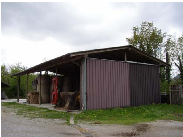
VISTA 3 Deposito attrezzi agricoli – vista da nord/est