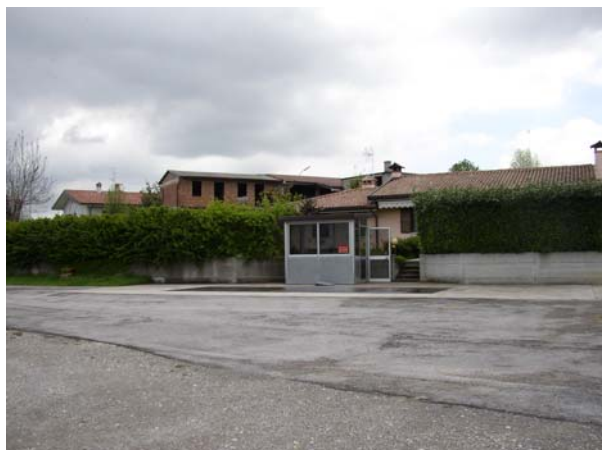
VISTA 2 Locale pesatura