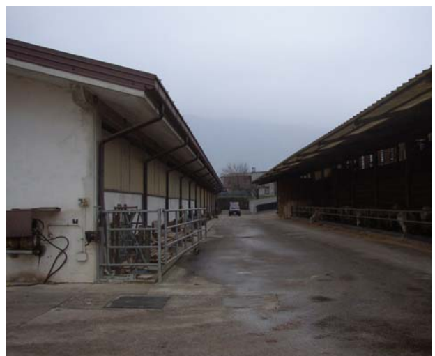
VISTA 12 Stalla e tettoia – vista da sud