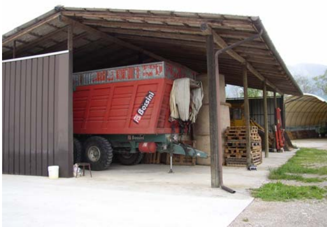
VISTA 5 Deposito attrezzi agricoli – vista da sud/est