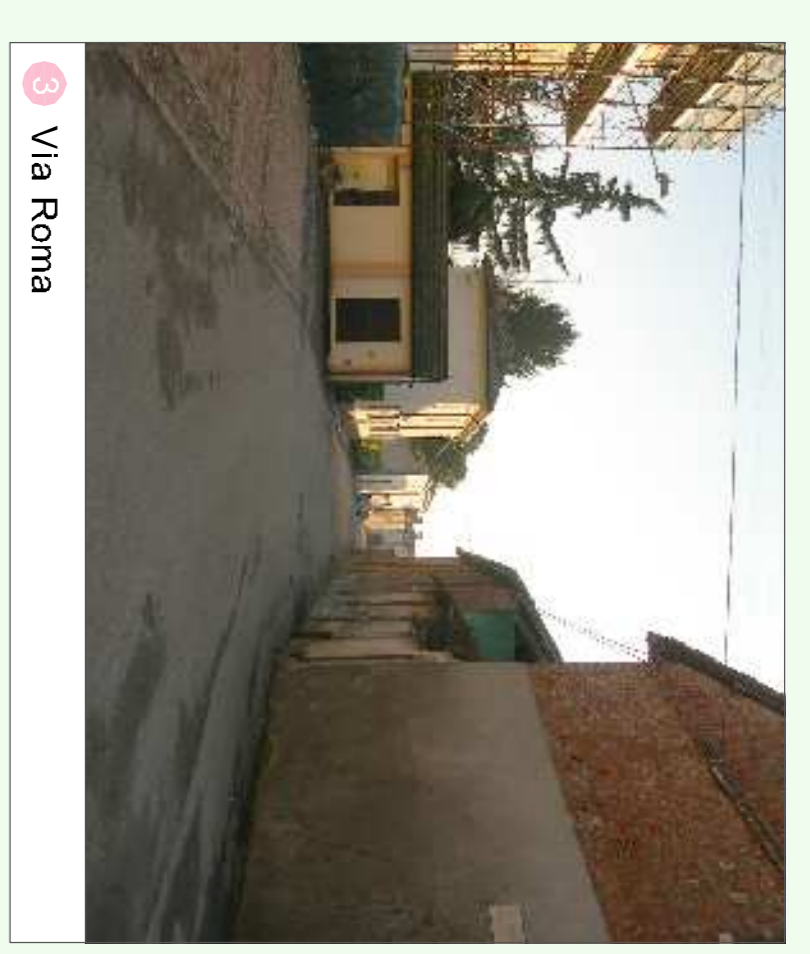
3 Via Roma