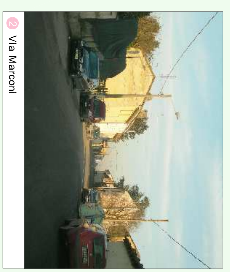
2 Via Marconi