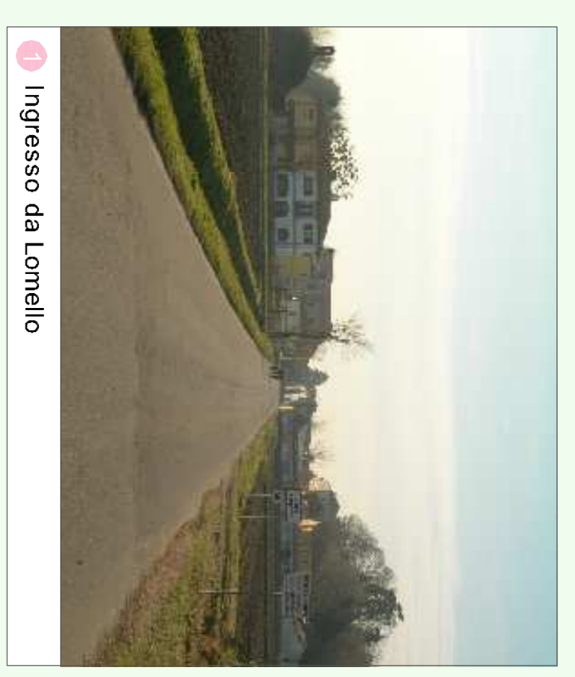
1 Ingresso da Lomello