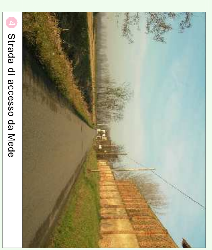
4 Strada di accesso da Meda